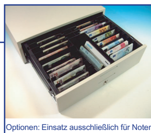
Optionen: Einsatz ausschließlich für Noten